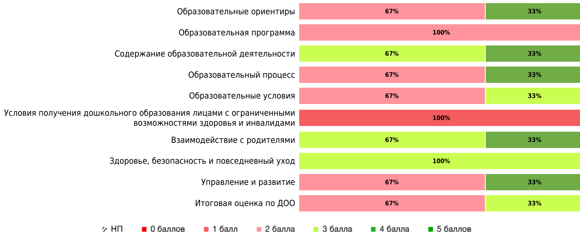
Доли ДОО с разными баллами у педагогов