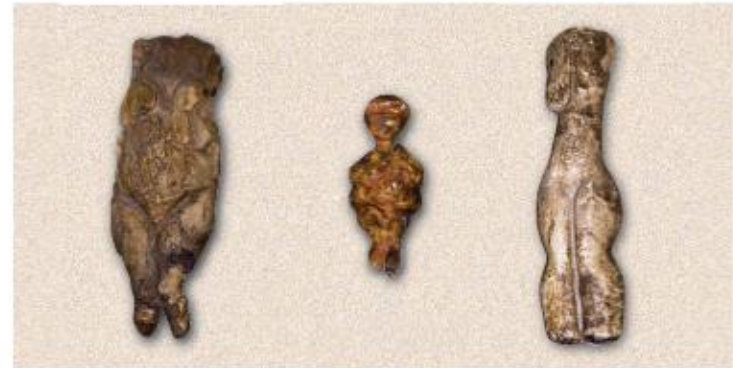
Каменные женские фигурки. Найдены на территории Башкортостана

Богатые собрания памятников первобытного искусства обнаружены и в других частях России. Например, на стоянках Костёнки и Гагарино на Дону, Мальга и Буреть на Ангаре. В Костёнках создан музей, где можно увидеть древние каменные и костяные фигурки, а также реконструкцию жилища, построенного из костей мамонта.