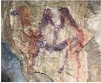
Верблюд. Рисунок в Каповой пещере

ученые обнаружили в Игнатьевской пещере изображения людей.