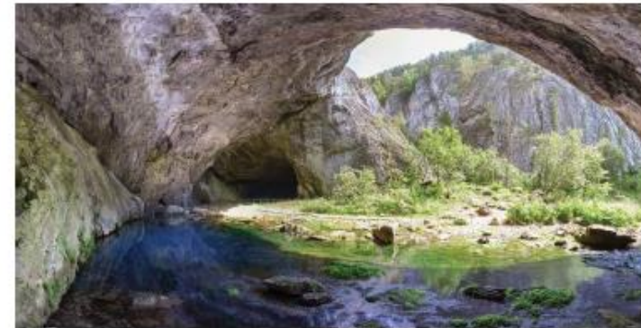
Вход в Капову пещеру

Человек, который оказался внутри, постоянно слышит звук капающей сверху воды. Как предполагают ученые, именно от