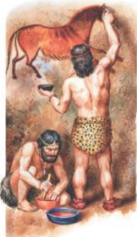
Древние художники. Современный рисунок

Искусство – важная часть духовной жизни человека, отражение мира в художественных образах, воплощенных в живописи, скульптуре, музыке и т. д.