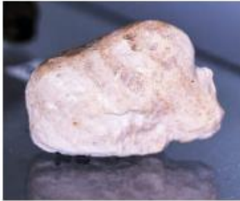
Каменная фигурка мамонта. Найдена на территории Башкортостана

Охотничья магия отразилась и в первобытной скульптуре малых форм. Это вырезанные из камня и кости фигурки животных. Однако более многочисленными были скульптурные изображения женщин, символизировавшие плодородие. Несколько подобных находок было сделано на территории Башкортостана.